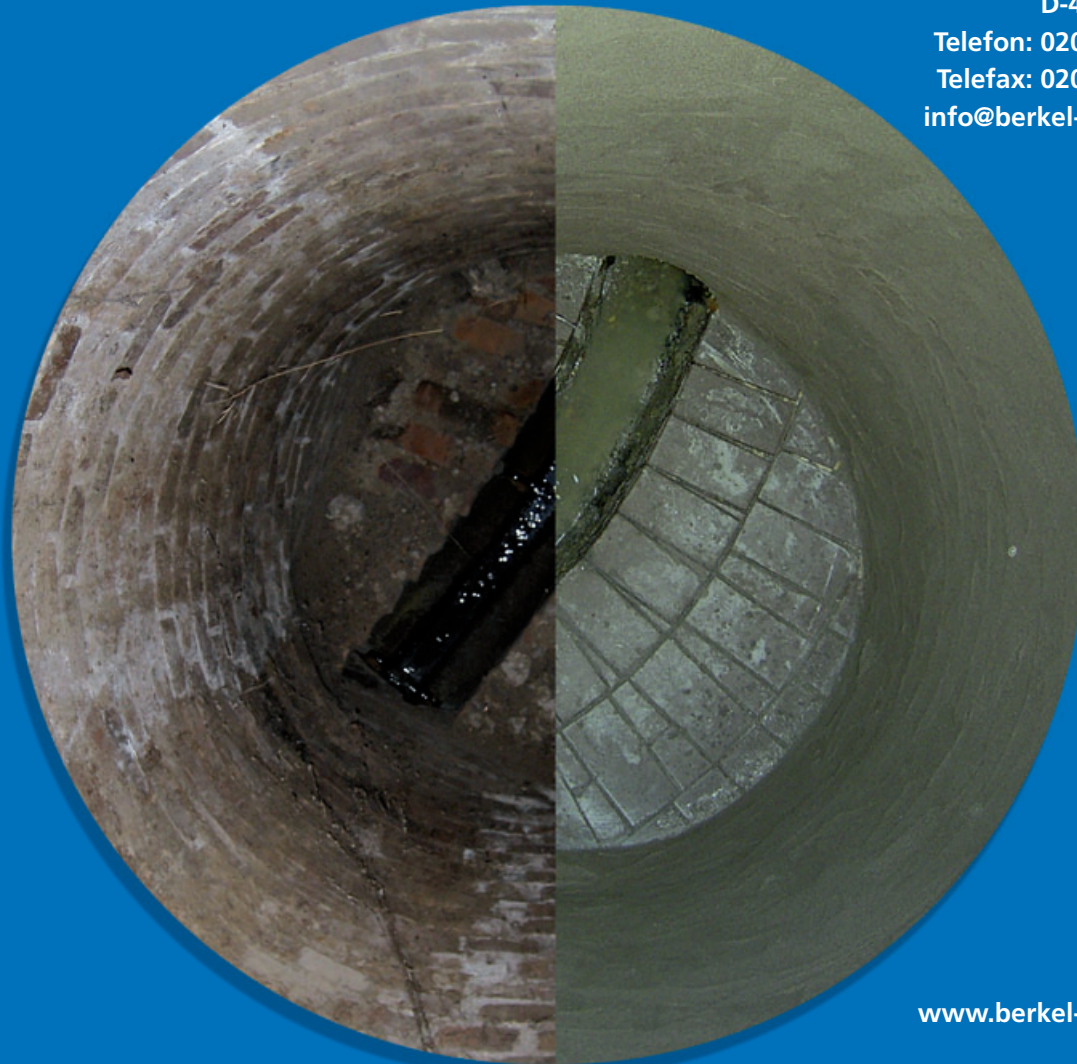
vor der Sanierung

BERKEL Rohrtechnik GmbH Franzstraße 25 D-45968 Gladbeck Telefon: 02043 / 4 01 17 78 Telefax: 02043 / 3 78 23 16 info@berkel-rohrtechnik.de