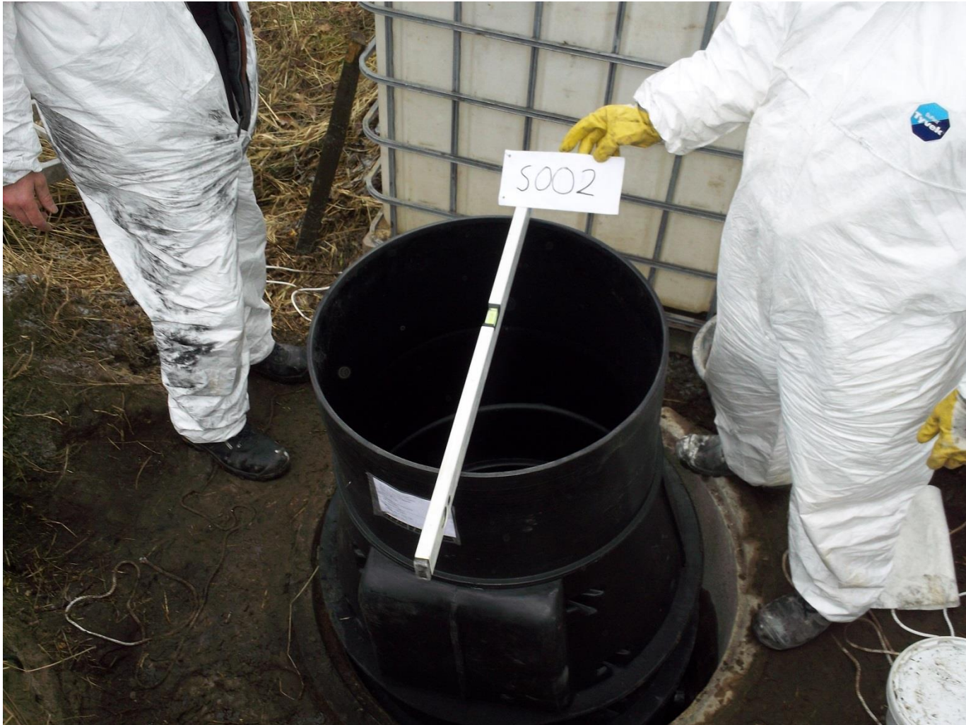
Aufsetzen der Dichtungen und Schachtbauteile