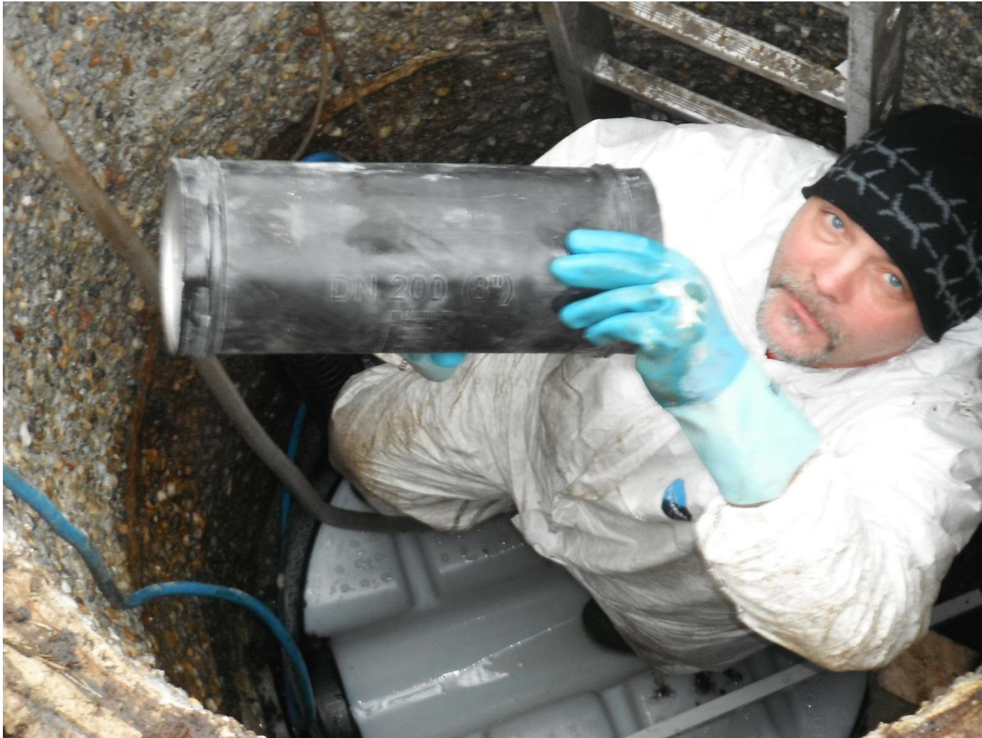
Quick Lock Manschette