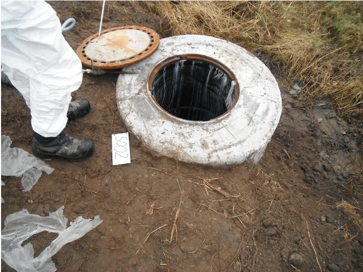
Fertig sanierter Schacht incl. lastentkoppelter Abdeckung