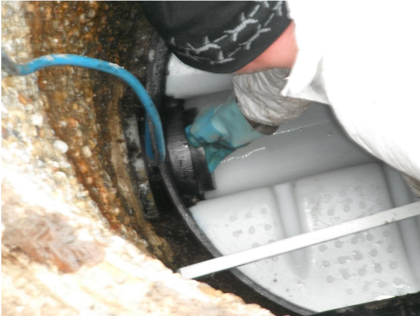
Setzen der Manschette