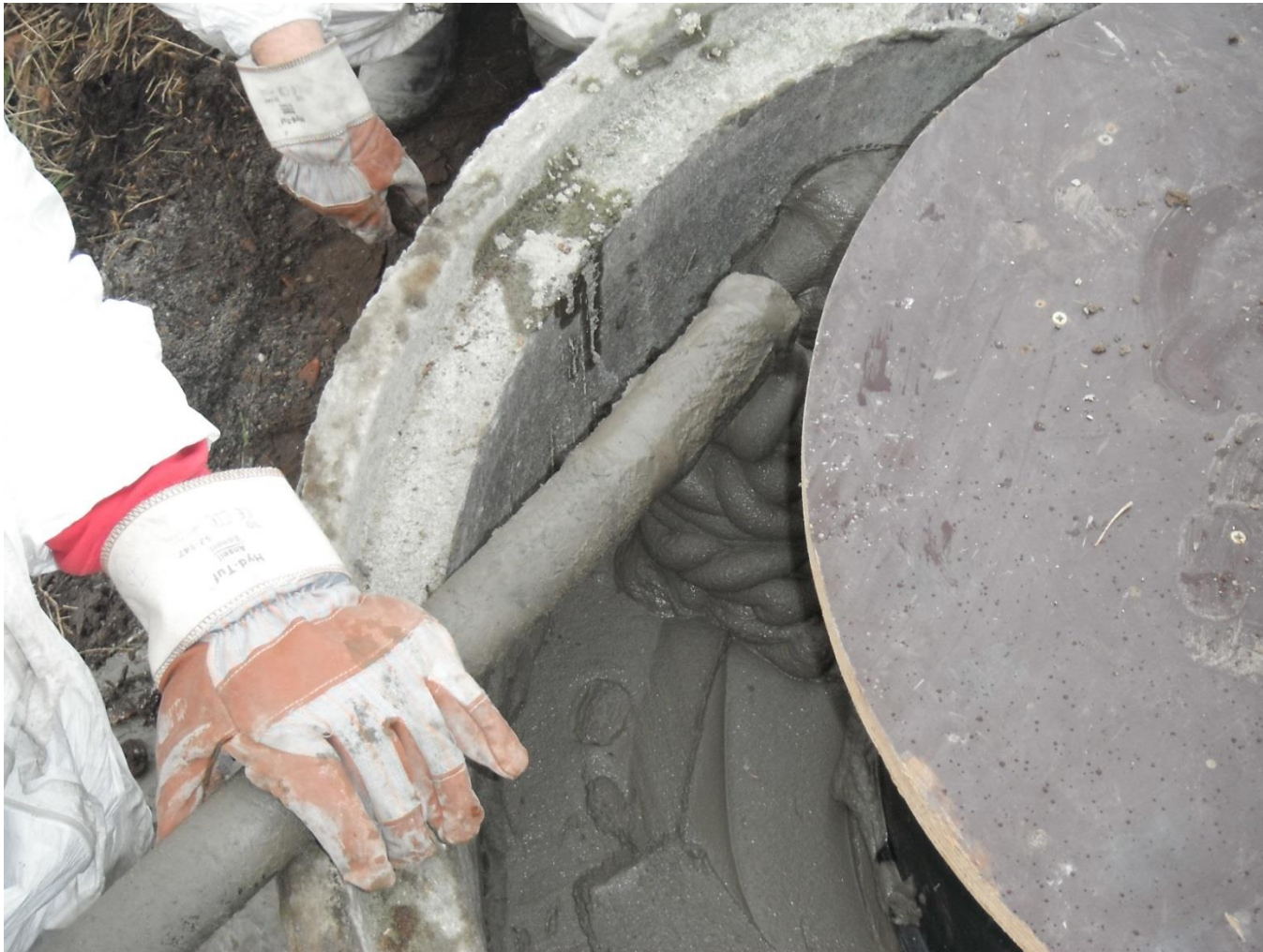
Verfüllen des Ringraumes zwischen PE – Schacht DN 800 und Betonschacht DN 1000