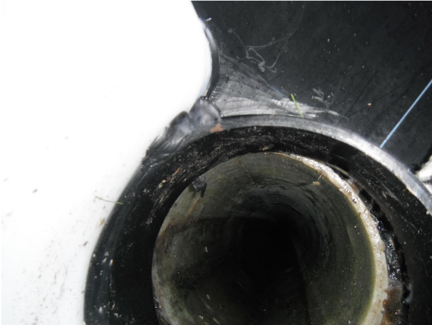
Anschluss an die Haltung