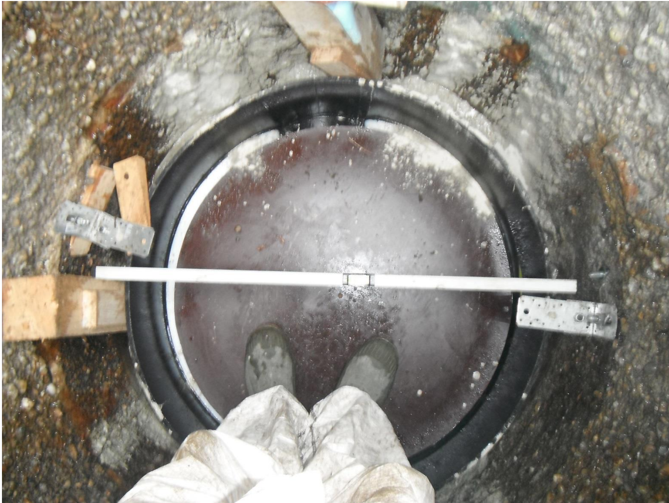
Vorgefertigtes Gerinne einsetzen