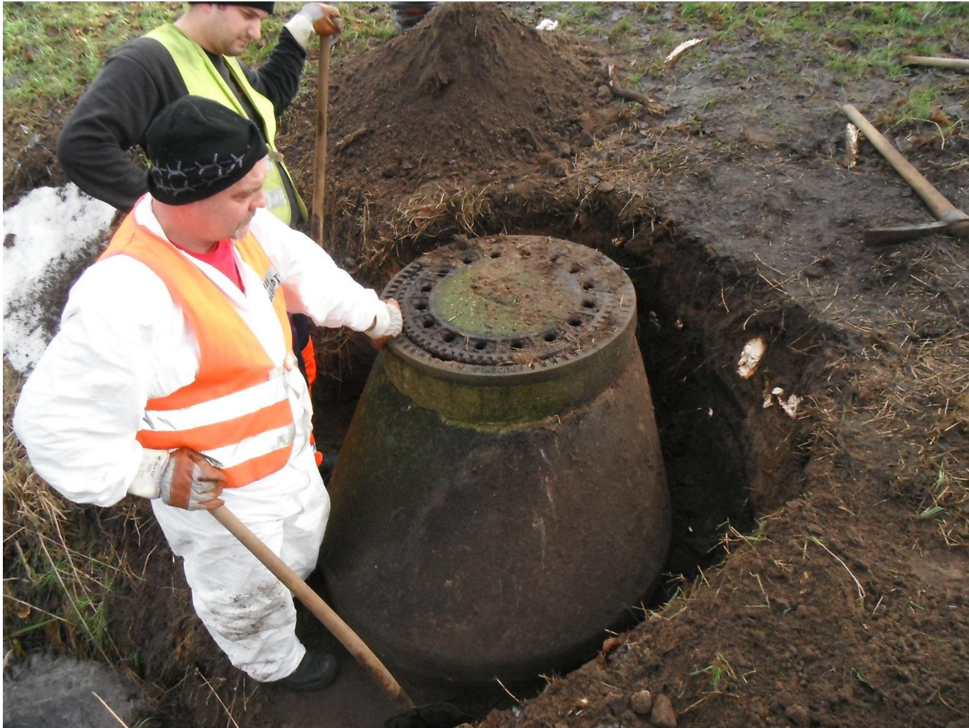
Konus freilegen und abheben